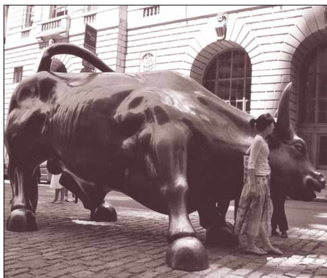
► Nowojorski Byk – jak długo jeszcze będzie sprzyjał hossie?

Utrzymywanie się przez wiele miesięcy wysokiego wzrostu gospodarczego wpływa na pobudzenie procesów inflacyjnych. Wg GUS w II kw. b.r. wskaźnik wzrostu cen dóbr i usług wyniósł średnio 2,4%. Zgodnie z najnowszą projekcją NBP, w IV kw. 2007 inflacja przekroczy 2,5% roku, a pod koniec 2009 zbliży się do 3,5%.